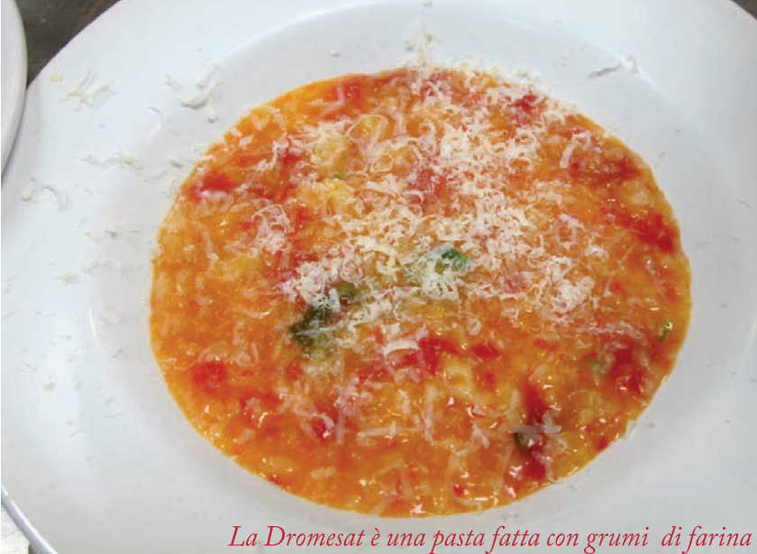
La Dromesat è una pasta fatta con grumi di farina

Italia. Nella tradizione gastronomica albanese non può mancare il rituale del mezze , di derivazione araba, equivalente ad uno spuntino consumato con una bevanda, o come già detto come antipasto. Può essere alquanto modesto, costituito solo da bocconi di cibi saporiti come dadini di formaggio, olive, noci salate e fettine di carne fredda, oppure più elaborato, fatto di svariati piatti freddi e caldi. Il mezze ha lo scopo di stimolare la sete e allo stesso tempo di evitare di ubriacarsi bevendo a digiuno. A quanto risulta, gli antichi "illiri" (gli antenati degli albanesi) iniziarono a produrre formaggio fin da epoca remota; oggi i formaggi albanesi più diffusi sono il djathë i bardhë , un formaggio bianco salato simile alla feta greca, e il djathë kaçavall , giallo e a pasta dura, che ricorda il caciocavallo italiano, un formaggio fatto con una cagliata di latte intero, le cui origini risalgono agli antichi Romani. Il latte serve